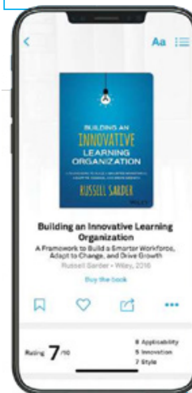
Sarder R. (2016) Building an Innovative Learning Organization