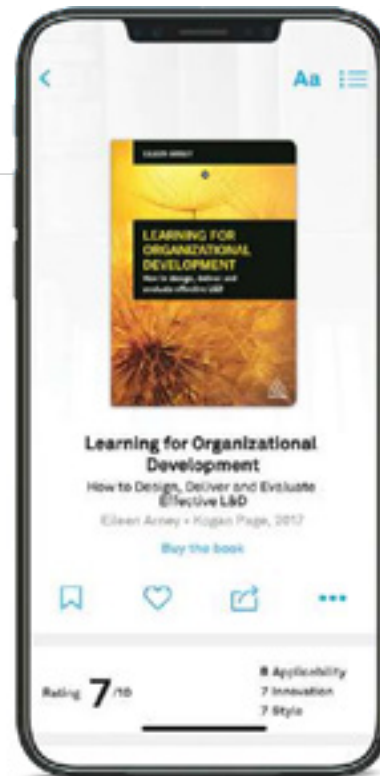
Arney E. (2017) Learning for Organizational Development