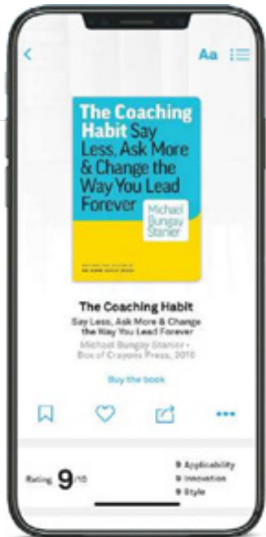
Bungay Stanier M. (2016) The Coaching Habit